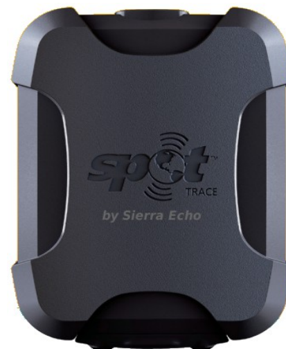
Spot Trace (taille réelle)