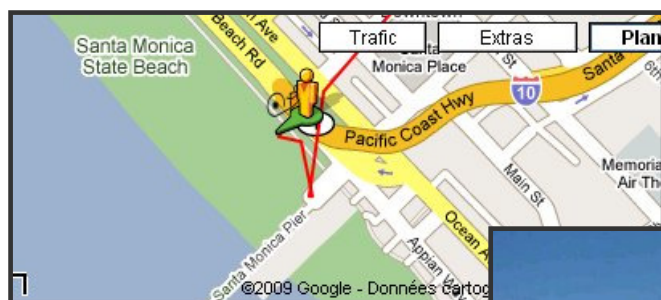
Etape finale (zoom) – Plage Santa Monica